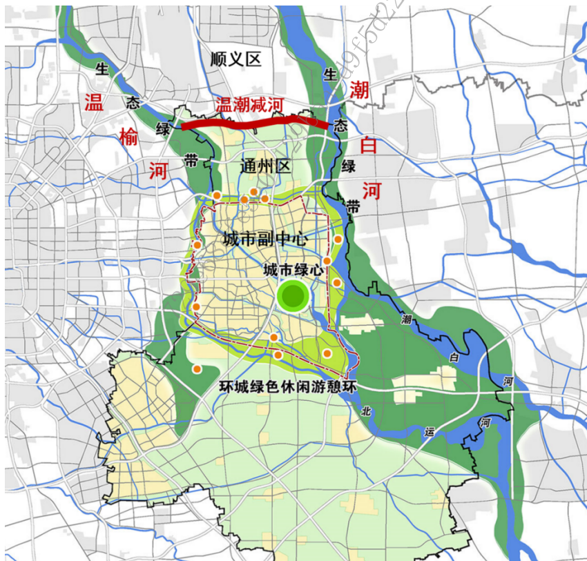
图 1-1 温潮减河分洪工程位置示意图

温潮减河工程设计起点位于温榆河左岸葛渠村西，穿越壁富路、东郊湿地公园，沿现状小中河向东南至通顺路，向东穿过通顺路、六环路，在张辛庄火车站南约 400m 处穿越京承铁路后转向东北，在内军庄村北及平家疃村北分别与月牙河及中坝河平交后，向东沿规划潮白河引水渠（平港沟），自岗北村北入潮白河，全长约 13km。温潮减河分洪工程位置详见下图。